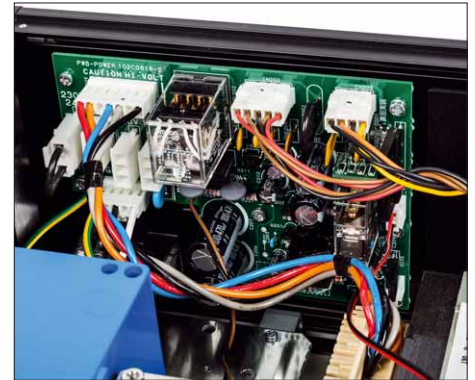
Ohne steuernde Elektronik geht's nicht: Diese Platine steckt in der Pneumatik-Steereinheit

des flachen, dünnen und sehr steifen Geweberiemens einstellen lässt. Fürs nötige Gewicht sorgt ein Klotz aus Bronze, in dem der eigentliche Motor steckt.