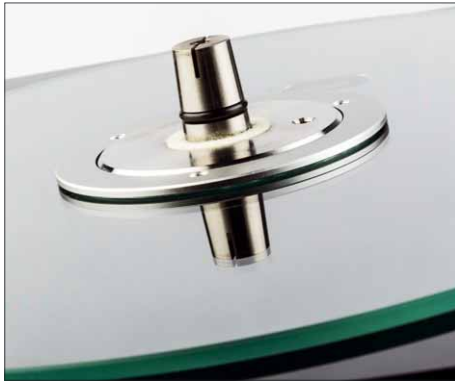
So sieht's unter dem Teller auf der Laufwerksbasis aus: Der Teller schwebt wenige Mikrometer über einer Glasplatte