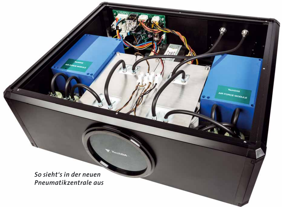
So sieht's in der neuen Pneumatikzentrale aus