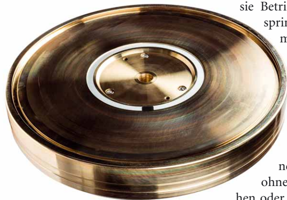
29 Kilogramm „Gun metal“: Der Bronzeteller ist die wichtigste Neuerung beim Air Force III Premium

Im Zuge der Montage des Reed 3P auf diesem Prachtstück von Plattenspieler muss ich nochmal das Loblied auf die Art und Weise singen, wie der Hersteller die Basenbefestigung gelöst hat. Es gibt eine lange und eine kurze Tonarmbasis, beide aus überfrästem gegossenem Aluminium gefertigt. Die eine ist nominell für Neun-Zoll-Arme gedacht, die andere für Zwölfzöller. Der Reed hat einen Einbauabstand von 295 Millimetern, will also die lange Version. Die Montage verschiedenster Arme auf dem Rondell aus 20 Millimeter starkem Material am Ende des Auslegers sollte kein Problem sein, für den Reed hatte ich seinerzeit schon eine Basis „gebaut“. Die wird auf einen der Edelstahlzylinder geschoben, von denen an jeder Ecke des Laufwerkes einer zu finden ist. Eine Kombination aus konischer Bohrung in der Armbasis, einer entsprechend ausgeformten Scheibe und einer Verschraubung erlaubt es, die Basis unverrückbar gegen die Laufwerks-