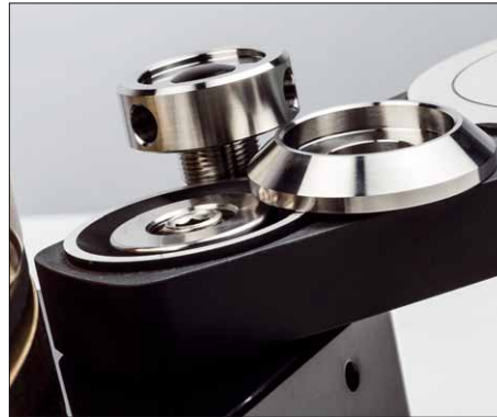
Die Befestigung der Tonarmbasen ist ein maschinenbauerisches Leckerchen