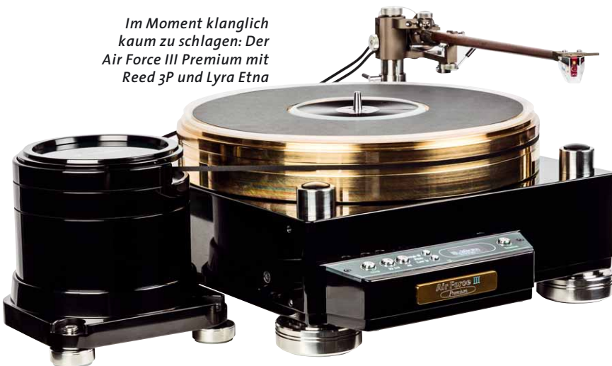
Im Moment klanglich kaum zu schlagen: Der Air Force III Premium mit Reed 3P und Lyra Etna