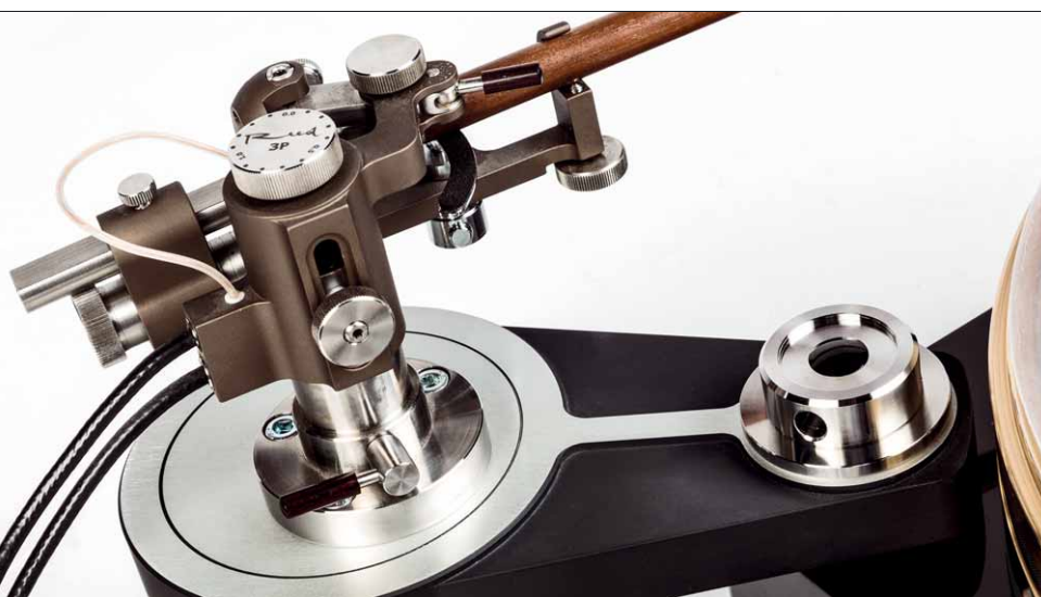
Die Tonarmausleger bestehen aus gegossenem Aluminium, die Rohlinge werden hinterher überfräst