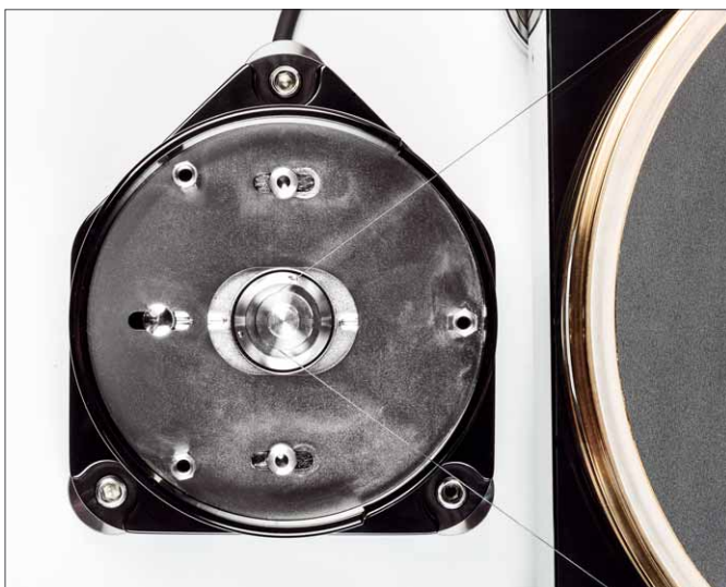
Der Antriebsmotor hängt in einem verschiebbaren Schlitten, über den sich die Riemenspannung einstellen lässt