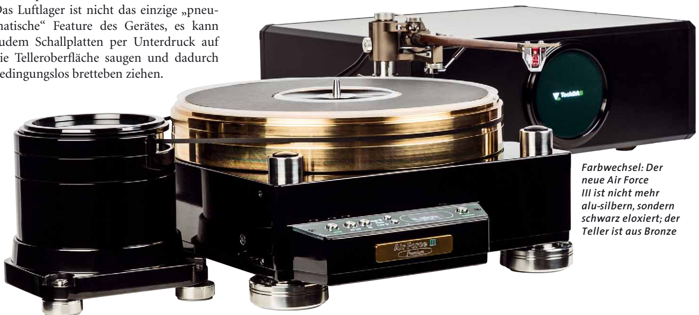
Farbwechsel: Der neue Air Force III ist nicht mehr alu-silbern, sondern schwarz eloxiert; der Teller ist aus Bronze