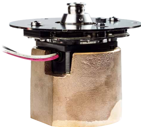
Ein Bronze-Klotz verleiht dem Motor ordentlich Gewicht

Denn so ungern ich das sage und so sehr ich mir auch gewünscht hätte, dass die Unterschiede zwischen den beiden „Air Forces“ vernachlässigbar sind – ganz so einfach ist die Sache nicht. Der Premium ist hörbar besser. Auch wenn wir hier von Unterschieden auf höchstem Niveau reden – sie sind unverkennbar vorhanden. Der Unerschütterlichkeit im Bassbereich des AF3 fügt der AF3P eine gewisse Leichtigkeit hinzu, er wirkt nicht ganz so wuchtig, befließigt sich tatsächlich jedoch einfach größerer Disziplin. Gut zu hören bei Stanley Clarkes einmaliger Saitenarbeit – der