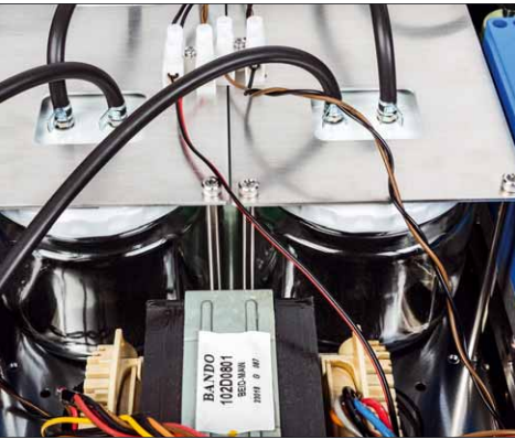
„Marmeladengläser“ fungieren in der Steuereinheit als Druckluft-Zwischenspeicher