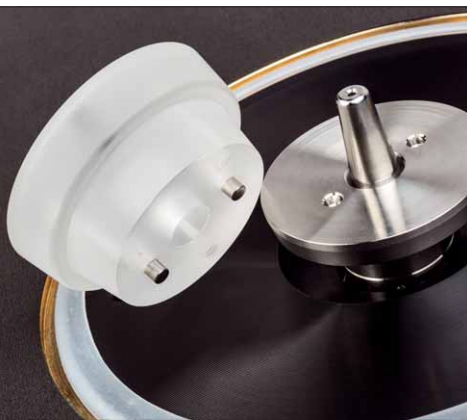
Detailänderungen gibt's beim Mitteldorn des Luftlagers. Er wird jetzt mit einem Spezialwerkzeug verschraubt

AF3P erleichtert den Zugang zur Musik einfach etwas mehr.